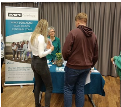
Fijne ontmoetingen tijdens de werkveldmarkt.

Graag dragen we ons steentje bij aan de opleiding van orthopedagogische begeleiders. We vinden het onze opdracht om toekomstige zorgprofessionals te laten kennismaken met het werkveld en hen zo warm te maken voor een job in de zorg. In samenwerking met Thomas More stonden er weer heel wat boeiende ontmoetingen op het programma.